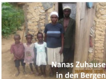
Nanas Zuhause in den Bergen